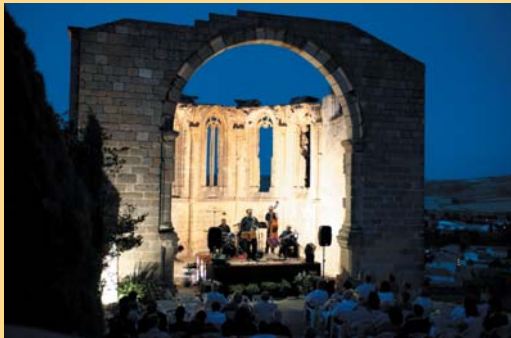
Sta. Mª Atienza 2011