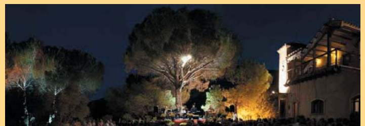
Panorama Calzadilla 2012

En estos cinco años la Fundación Huete Futuro a través de los dos ciclos de música que organiza, Jazz y Adviento-Navidad, y las actuaciones de los Encuentros