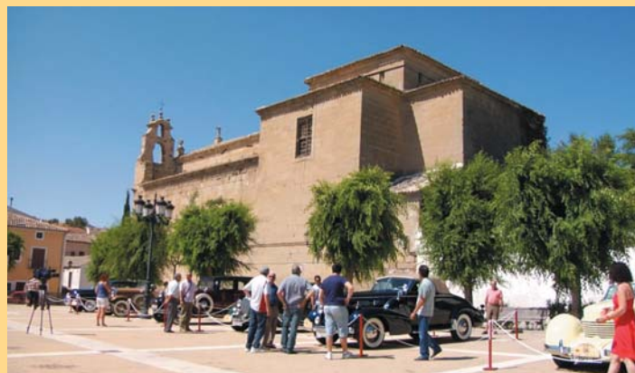
Exposición vehículos clásicos 2012

Informativos anuales, ha celebrado un total de 20 conciertos musicales, más una actuación de música, danza, canto e interpretación gestual, así como la representación de una obra de teatro. En el conjunto de estas 22 celebraciones han participado más de cinco mil personas. Además, el primer fin de semana de julio de 2012, se organizó una concentración-exposición de coches clásicos, anteriores a 1945, y el 1er Rally Huete-Buendía-Huete de estos vehículos.