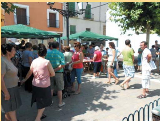
Mecedillo Pepino 2010