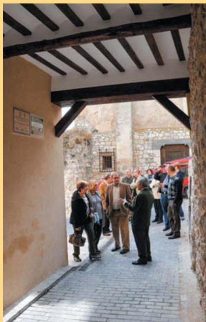
Inauguración Pasadizo 2013

El pasado año 2013 la Fundación Huete Futuro llevó a cabo la restauración del Pasadizo del Callejón del Moro y de algunas de las fachadas alledañas. Un lugar emblemático de arquitectura popular de lo poco que aún conservamos y que estaba en peligro de desaparecer. El proyecto inició su andadura y gestiones a comienzos de 2012 con un presupuesto de 44.040'01€, se consiguió una ayuda del programa LEADER de 14.558'67€, los propietarios privados aportaron 6.199'00€ y la Fundación ha tenido que aportar 23.282'34€. Este proyecto ha supuesto un gran esfuerzo para las posibilidades financieras de la Fundación y nos ha dejado los recursos exhaustos, no obstante se consiguió la financiación gracias a la búsqueda y coordinación de diversas donaciones y aportaciones