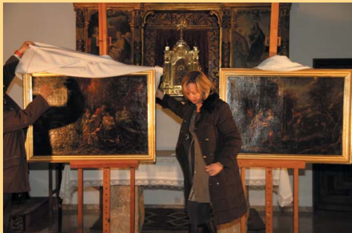
Entrega lienzos restaurados 2011

Con respecto al patrimonio mobiliario a lo largo de estos cinco años, gracias a la Fundación Huete Futuro , se han restaurado seis lienzos del Museo de Arte Sacro, así como sus correspondientes marcos, y se ha recibido la donación de un marco dorado de finales del siglo XIX que se pudo adaptar a un lienzo del apóstol Santiago de medio cuerpo que se exhibe en el museo.