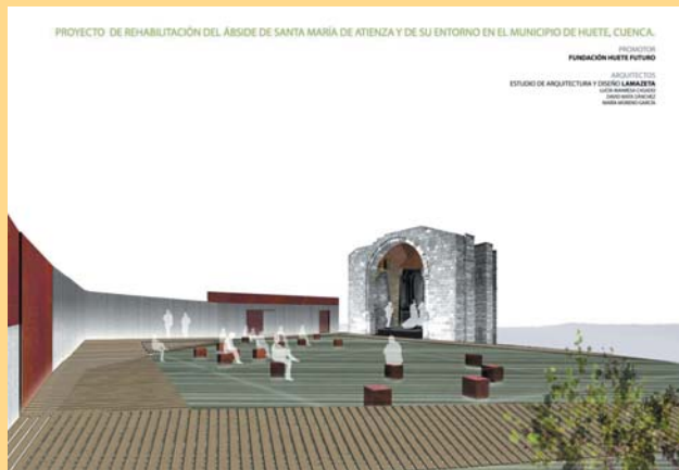
Proyecto de Santa María de Atienza 2009