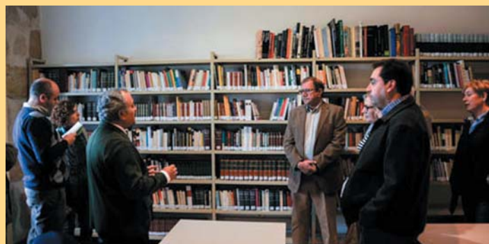
Entrega libros 2013

A comienzos de 2013 recibimos la donación de una colección de 1.300 libros compuesta fundamentalmente por novela, poesía, ensayo,... aunque también había libros, en menor número, de viajes, historia, etc. La Fundación Huete Futuro ha depositado esta donación en el ayuntamiento de Huete para que pueda ser usado en préstamo por los optenses, instalándose, con este objetivo, unas estanterías financiadas por la Fundación en el aula que la Universidad Nacional de Educación a Distancia tiene en La Merced.