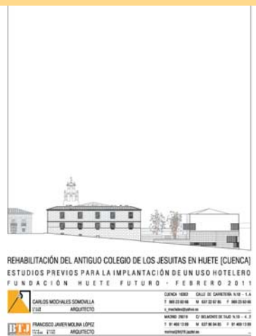
Estudios previos Proyecto Jesuitas 2011

Aunque no ha transcendido, la Fundación Huete Futuro encargó en septiembre del año 2010 a dos estudios de arquitectura la elaboración conjunta de "Estudios previos para la rehabilitación del antiguo Colegio de los Jesuitas en Huete y su adecuación para la implantación de un uso hotelero" con el objetivo de presentarlo y financiar, total o parcialmente, a través del Plan de Zona de la Ley de Desarrollo Sostenible del Medio Rural. En las propuestas iniciales del